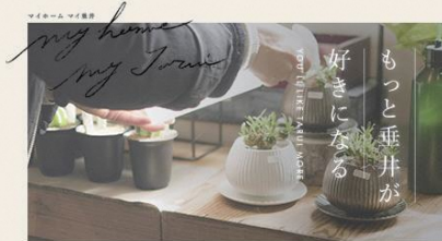
垂井町移住・定住 サポートサイト「my home my Tarui」